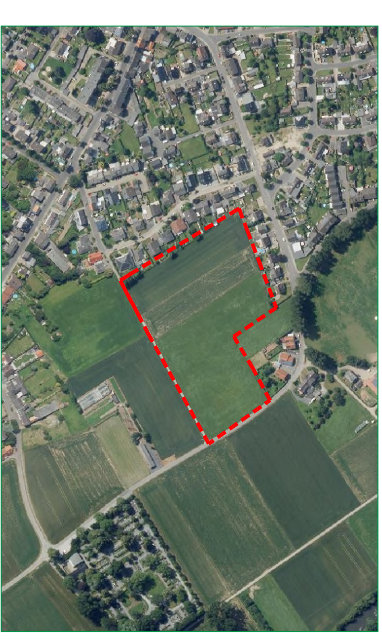
Übersichtskarte - ohne Maßstab

Landschaftspflegerischer Fachbeitrag Karte 2 M : 1 : 1000 Zustand nach B-Plan